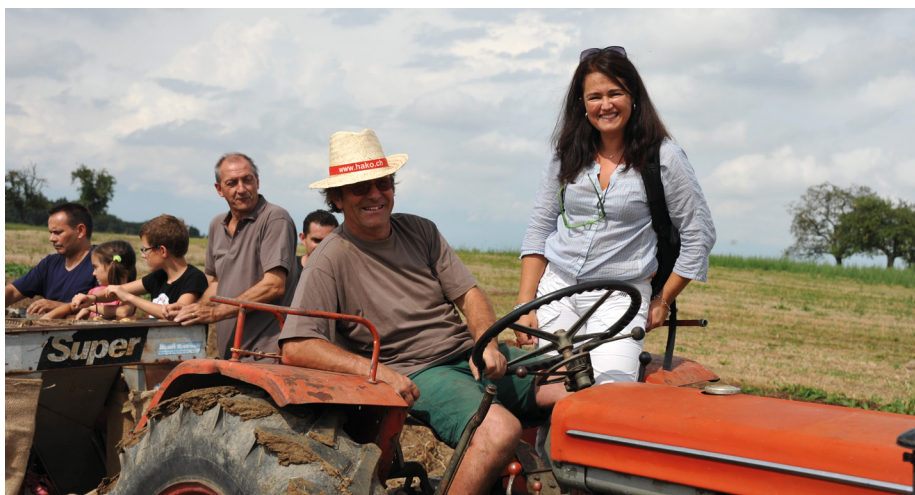
En 2013 quelqu'un avait emprunté mon appareil photo lors de la fête de la patate

Après 18 années passées au sein de la rédaction du Journal Contact, après avoir réalisé la mise en page de vingt-cinq numéros, il est temps pour moi de tourner ma page.