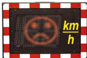
En dessus de 50 Km/h

Voici le relevé des enregistrement prélevés.