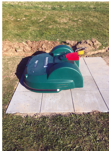
Le robot ne tond que la nuit!

En conclusion, l'acquisition de ce robot-tondeur représente une économie intéressante en termes de main-d'œuvre et d'équipements, une augmentation