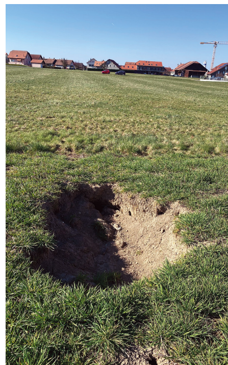
Effondrement dans un champ