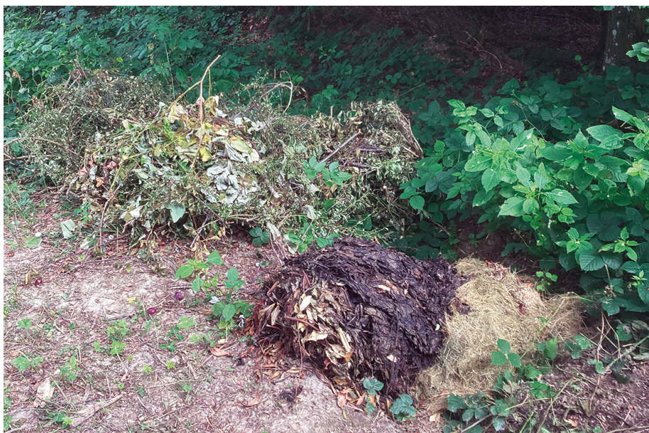
Les déchets de jardin n'ont pas leur place dans la forêt