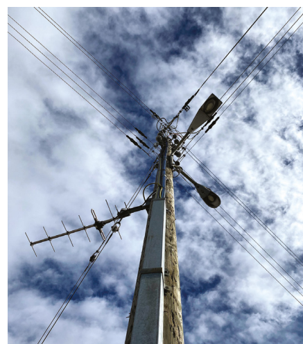
Poteau électrique actuel avec lampadaire