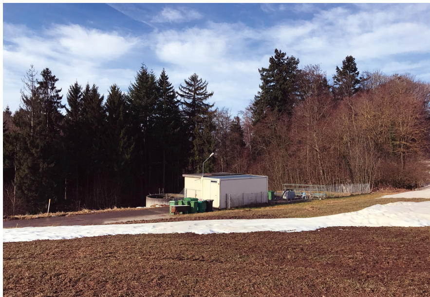
Notre STEP se trouve au lieu-dit : Creux d'Enfer...tout est dit !

https://www.vd.ch/themes/environnement/eaux/protection-des-eaux-epuration-pgee-agriculture-biologie-et-chimie-des-eaux/evacuation-et-epuration-des-eaux-stations-depuration-des-eaux-usees-step/