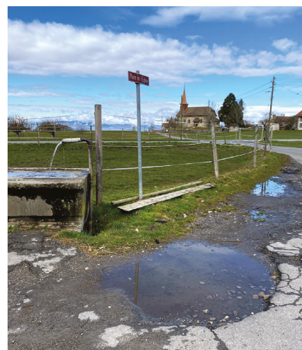
Place de l'église en 2019

Patricia Riva, municipale en charge de l'épuration