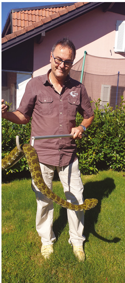
La vipère verte chinoise du Mont Mang Shan

Quand vous partez à la rencontre d'un vice-champion olympique de tir au pistolet doublé d'un spécialiste des reptiles venimeux, mieux vaut bien choisir ses questions.