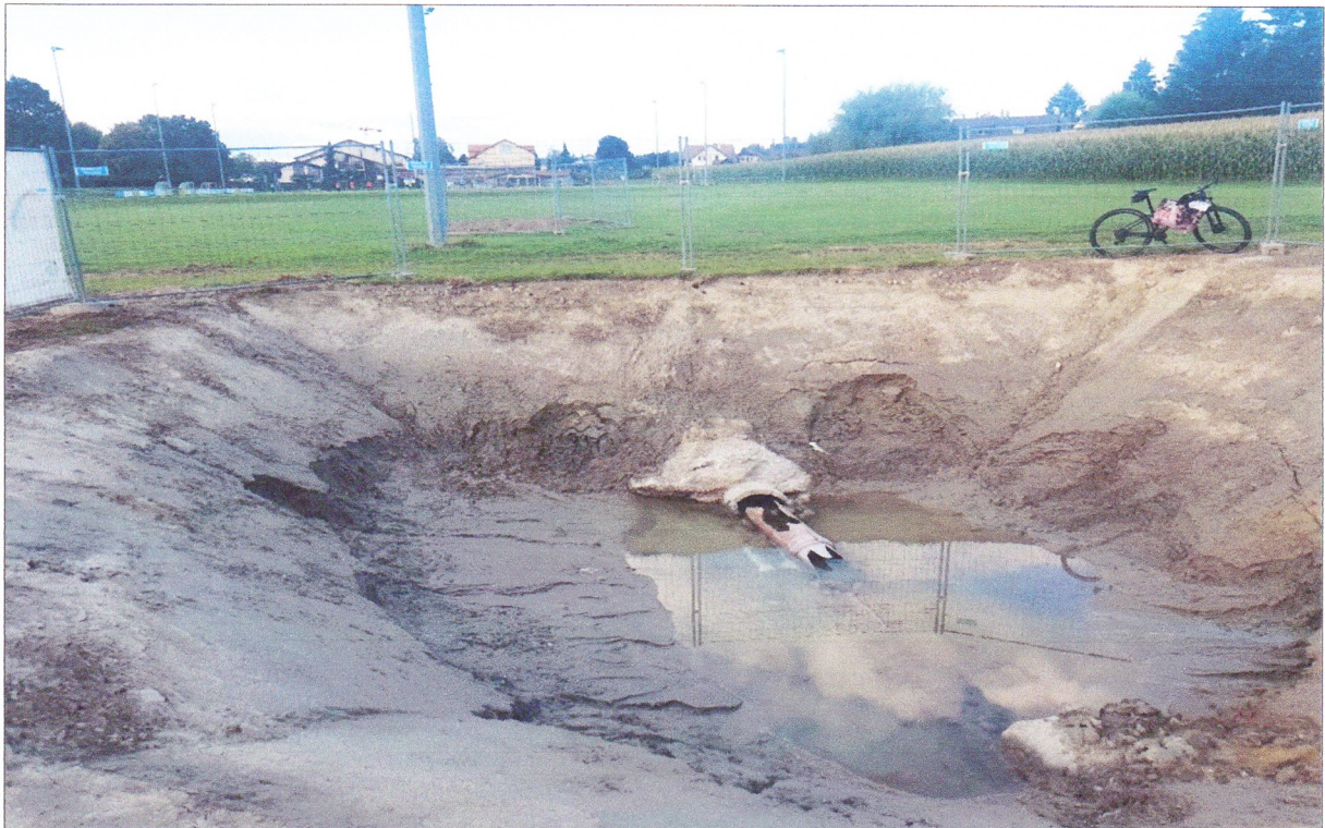
Figure 1 : Aperçu d'une partie de la conduite sur la parcelle n° 313 RF

Cette façon peu orthodoxe de procéder de notre municipalité est dictée par l'urgence et il ne saurait en être tenu rigueur à notre collège municipal. En effet, les exceptions font parties de la règle et nous sommes, dans ce cas de figure, face à une exception.