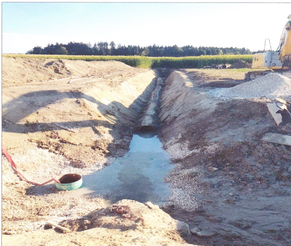
Figure 2 : Aperçu du tronçon à remplacer

L'étude réalisée par PIAL Liaudet SA démontre également que la pente d'écoulement équivaut à une pente moyenne de 0,7%, ce qui est faible. De plus, il est constaté que les mouvements de terrain, dus à un sous-sol partiellement constitué de limon fluide, transforment cette conduite centenaire en montagnes russes avec une contre-pente, mais également que cette conduite avait déjà fait l'objet d'une précédente réparation, comme en atteste la présence sur quelques mètres d'un tuyau PVC (figure 1). Une nouvelle surprise, tient au fait de la découverte que non seulement la conduite d'eau claire traverse de part en part le terrain de football, mais qu'un dépotoir existe (non accessible et pour cause) devant les buts coté Lausanne !