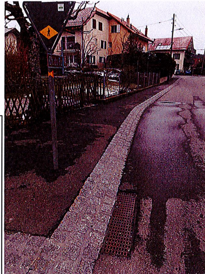
Trottoirs existants au Ch. du Ru