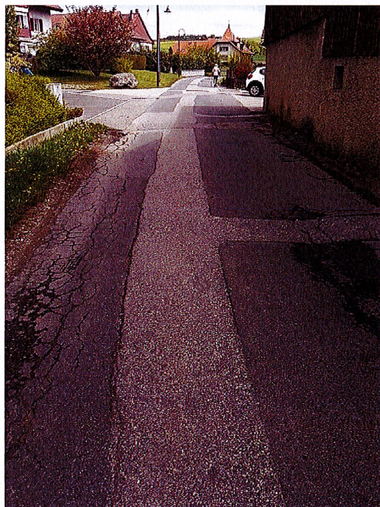
Dégradations de l'enrobé