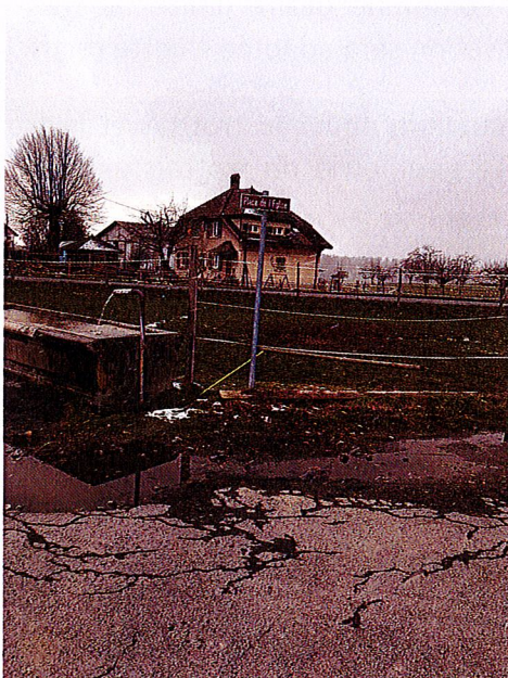
Place de l'église actuelle

La fontaine en ciment date de 1909. Elle est inscrite au recensement architectural du Canton de Vaud. Une remise en état sera peut-être à envisager par la suite.