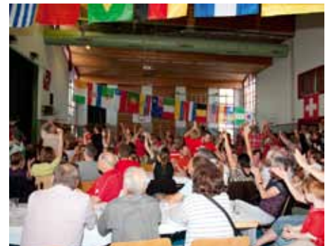
Lors de la projection des matchs du Mondial sur grand écran, des brésiliennes ont fait leur show. Le comité a travaillé durement durant les quatre semaines. La population a répondu présent!