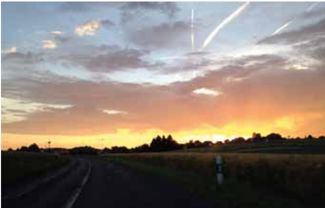
Envoyé par David Cordey "Y a t'il le feu au village?", 22 juin 6h00

Faites vivre cette rubrique photo en nous envoyant une photo originale, jolie ou insolite prise avec votre smart-phone ou votre appareil photo.