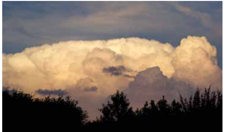
Envoyé par Guy Delpierre "Nuages sur Bottens", un soir de juillet 2014.