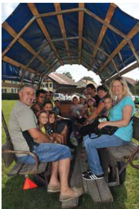
Fête de la patate