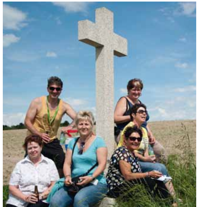
20e Jumelage: Rallye à travers le village