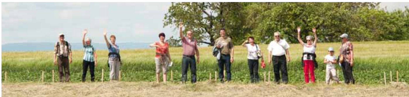
20e Jumelage: Rallye à travers le village