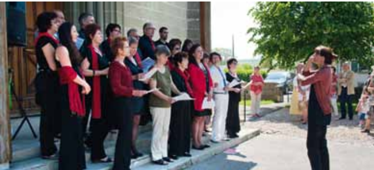
20e Jumelage: la Clé de Sol, le dimanche à la sortie de l'église