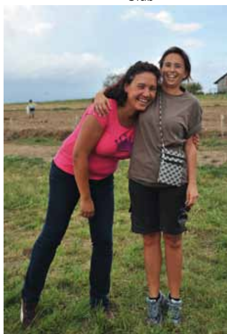
Fête de la patate