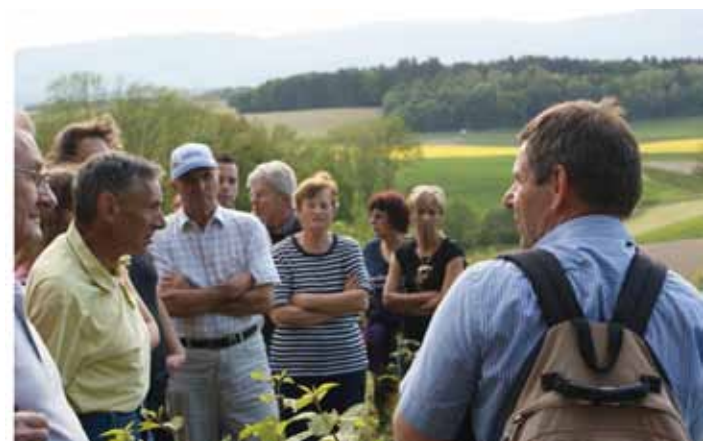
Agenda 21: balade de l'or bleu