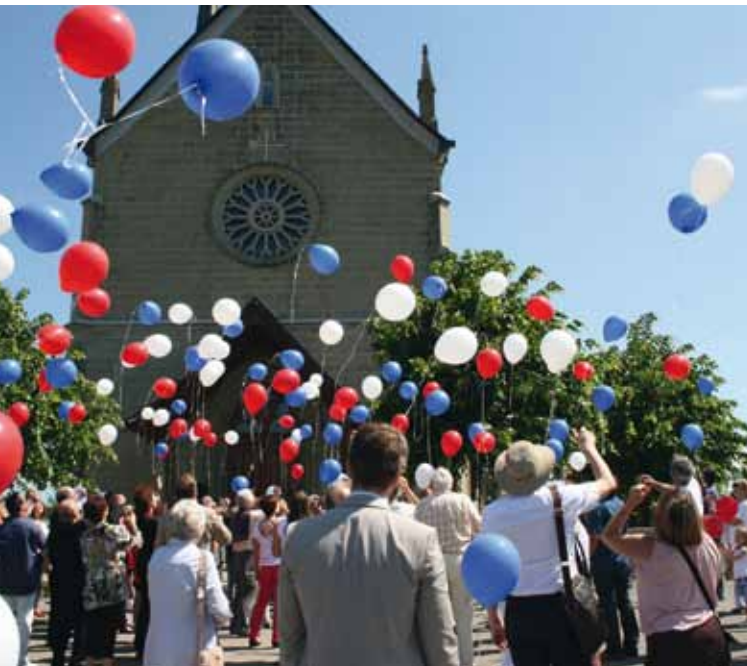
20e Jumelage: Lâcher de ballons