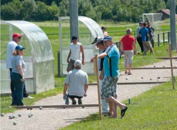
20e Jumelage: Tournoi de pétanque