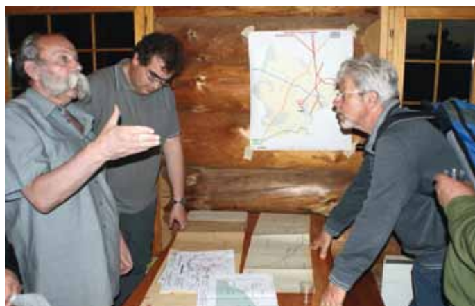
Agenda 21: balade de l'or bleu