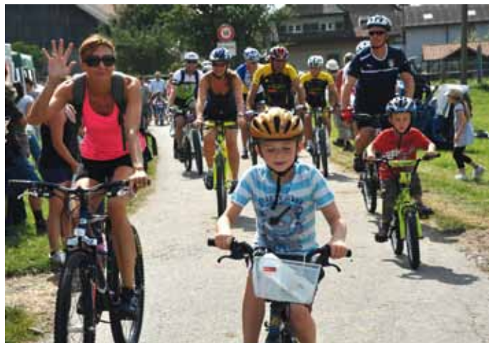
Fête de la patate: randonnée à vélo organisée par le Ski-Club