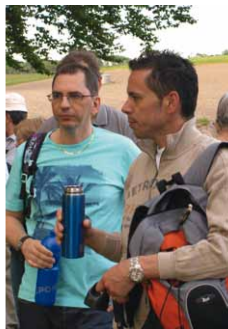
Agenda 21: balade de l'or bleu