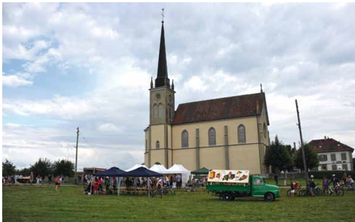
Fête de la patate 2013

La Municipalité est consciente des enjeux liés à l'énergie (...) (p.5)