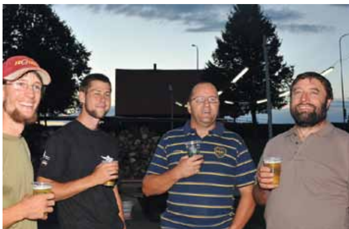
Fête de la patate: la nuit de la raisinée