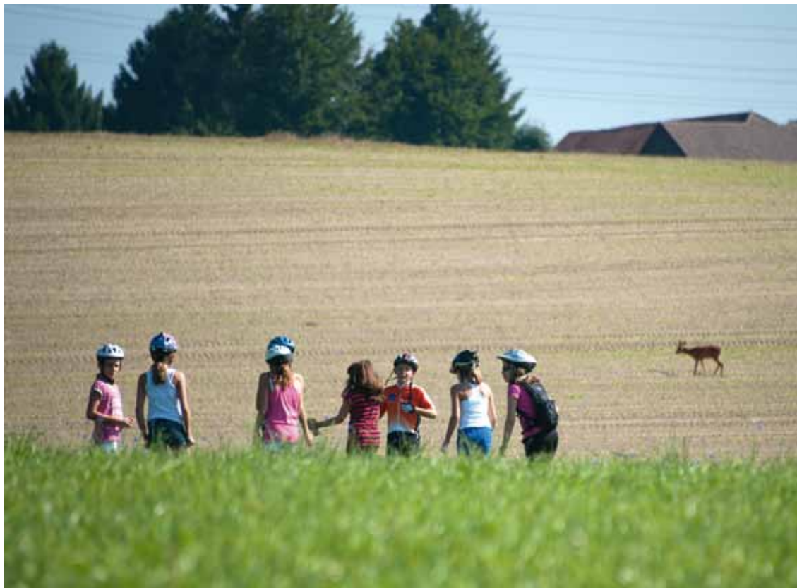
Fête de la patate 2012 - Un groupe de jeunes cyclistes tentent d'approcher une biche