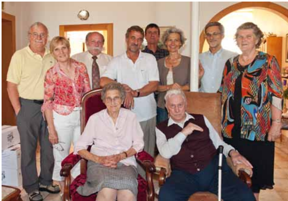
Photo prise lors de la visite de la Municipalité