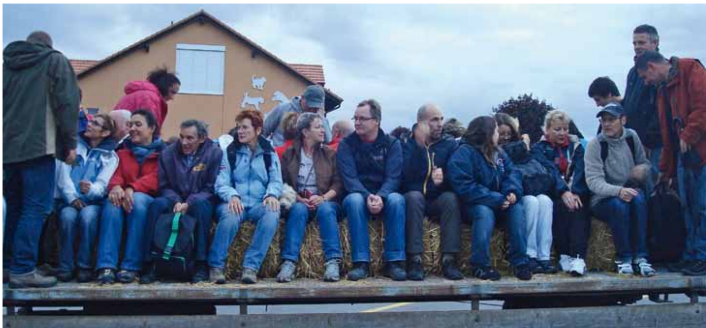
Dominomobile prête pour le départ-Semaine de la mobilité